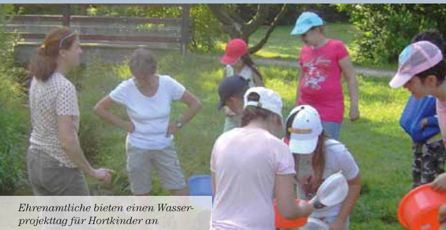
Ehrenamtliche bieten einen Wasserprojekttag für Hortkinder an

Nein. Einmal ist ein Mann auf eigenen Wunsch ausgeschieden, der ganz wunderbar mit den Kindern geschreiner